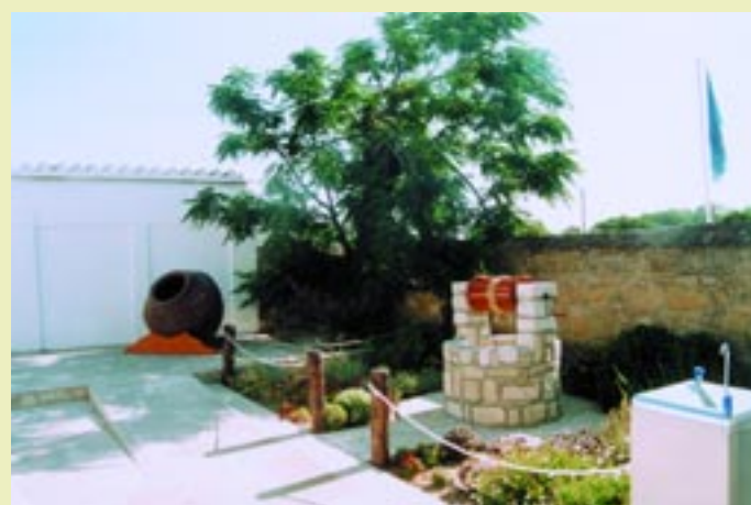
Άποψη της εσωτερικής αυλής του Κέντρου A view of the inner yard of the Centre