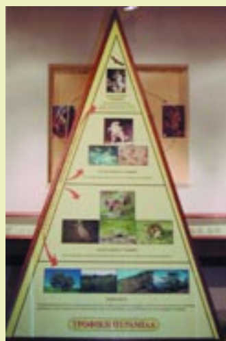
Αναπαράσταση της τροφικής πυραμίδας Representation of food pyramid