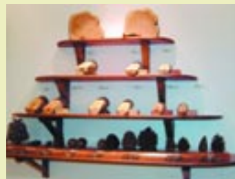
Δείγματα ξύλου, καρπών και σπόρων δασικών δέντρων Specimens of wood, fruits and seeds of forest trees