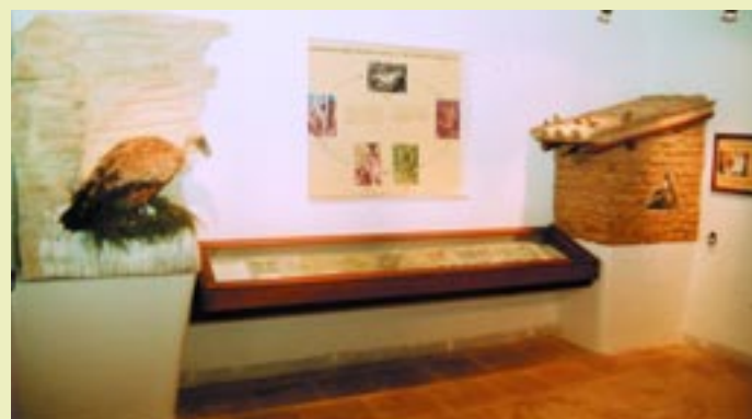
Εκθέματα πανίδας Fauna exhibits