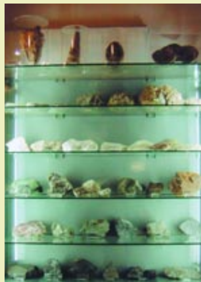
Γεωλογική συλλογή και απολιθώματα Geological collection and fossils exhibit