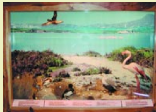
Διόραμα της αλυκής της Λάρνακας Diorama of Larnaka salt lake