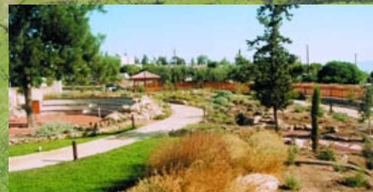
Άποψη του Βοτανικού κήπου A view of the botanical garden