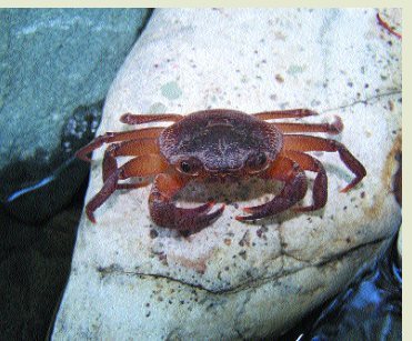
Κάβουρας του γλυκού νερού- Potamon potamius