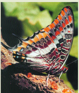
Πεταλούδα- Charaxes jasius

Εξέχουσα θέση κατέχουν οι “βασίλισσες” όλων των εντόμων, οι πεταλούδες που ανήκουν στην τάξη των λεπιδοπτέρων. Ιδιαίτερα αγαπητές, σύμβολα ζωής και μορφιάς, συνυφασμένες με την άνοιξη και τα πολύχρωμα λουλούδια προκαλούν το ενδιαφέρον των μελετητών. Υπάρχουν 52 είδη πεταλούδων στο τόπο μας από τα οποία 9 είναι ενδημικά.